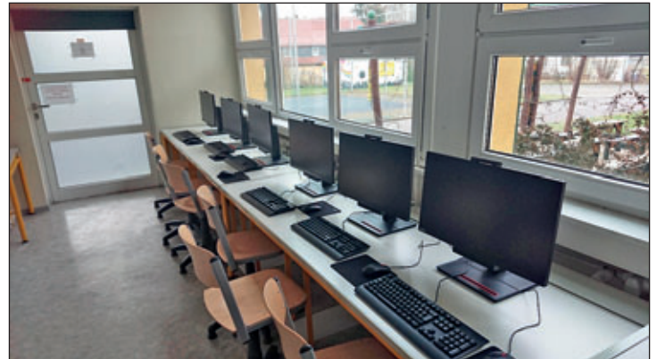
Für die Oberschule wurden 34 neue Computer beschafft.

In einem letzten Schritt zur Herstellung der aktiven Infrastruktur ist die