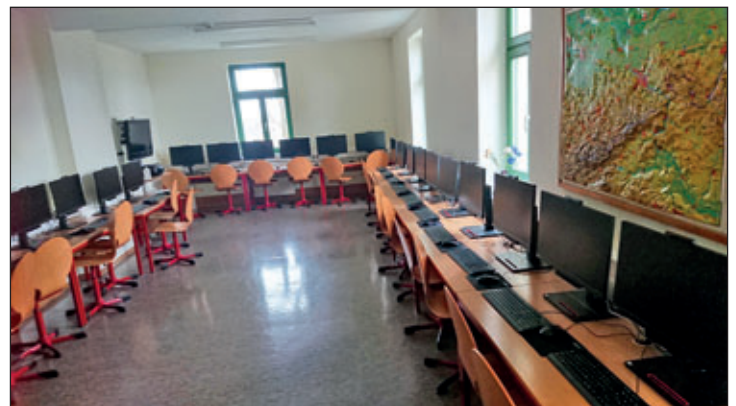
Der Grundschule Raußnitz konnten 26 Rechner sowie 12 Laptops übergeben werden.