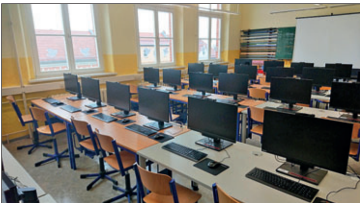
Die Grundschule in Nossen hat 29 neue Arbeitsplatzrechner sowie 20 Notebooks einschließlich Aufbewahrungsstationen erhalten.